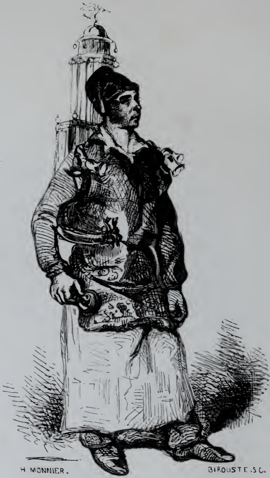
Le Marchand de Coco.